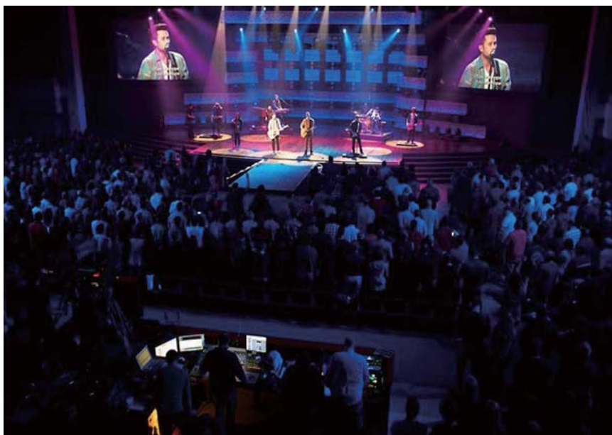
ライブコンサートやリモートプロダクションはPTPの恩恵を受けることができます。

ターフェースを出入りする時間を 正確に測定する必要があります。 そのためには、PTPアルゴリ ズムで使用されるデータを収集 できるすべてのネットワーク・ インターフェースにタイムスタ ンプ測定用のハードウェアを 組み込む必要があります。